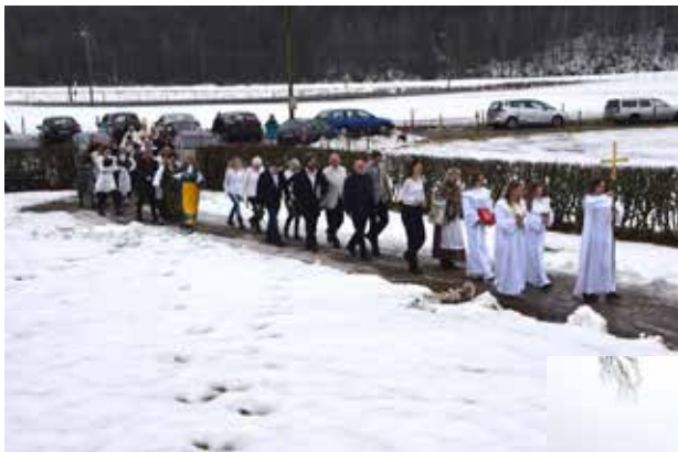
Procession från församlingshemmet.

Den 4 februari återinvigdes Seglora kyrka efter en stor renovering invändigt. Ceremonin startade med en procession från församlingshemmet. Biskop Åke Bonnier bankade därefter tre gånger på kyrkans port, se bild på framsidan och besökarna fick gå in och ta plats.